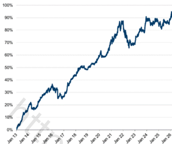
Performance Attribution – Long Book 2